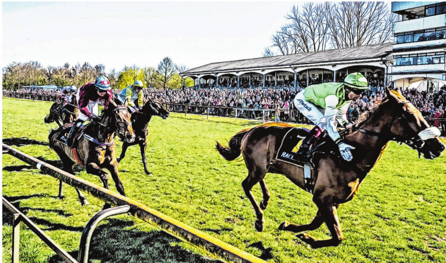
Vor sieben Jahren hat die Mehrheit der Bremer noch Nein gesagt zur Bebauung auf der Rennbahn. Heute sieht das anders aus.

ILLUSTRATION: NACH EINEM FOTO VON CHRISTINA KUHAUPT