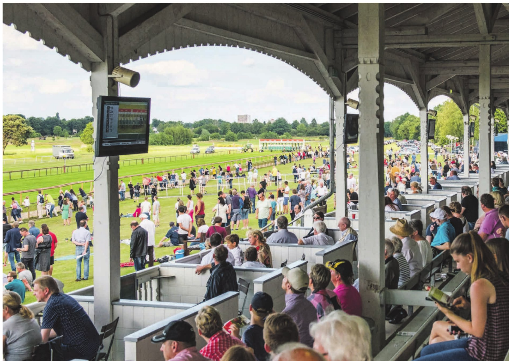
So sah es auf der Galopprennbahn zum letzten Mal an Ostern 2022 aus. Damals fand die mehr als 100-jährige Rennsportgeschichte auf diesem Areal ihren Abschluss.

„Wir freuen uns, dass an dieser Stelle wieder Leben einkehrt“, sagt Hotelchef Kohlhasse. Er bedauert, dass die Fläche im ehemaligen Zielbereich der Rennstrecke nicht schon viel früher und viel häufiger bespielt wird. „Das wäre eine extrem gute Kulturflä-