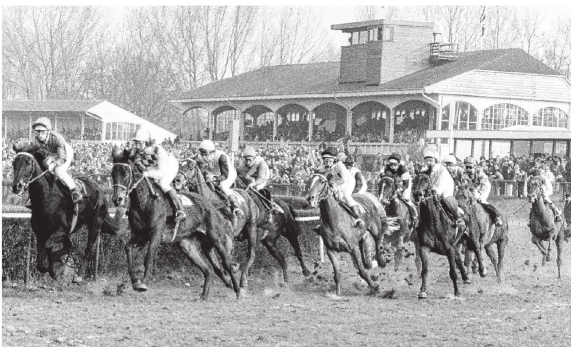
Anfang der 1980er-Jahre stand die zweite Tribüne (links) noch. Die aktuelle Haupttribüne mit ihren sieben Bögen hat ihr Aussehen verändert. Den Turmaufbau gibt es nicht mehr.