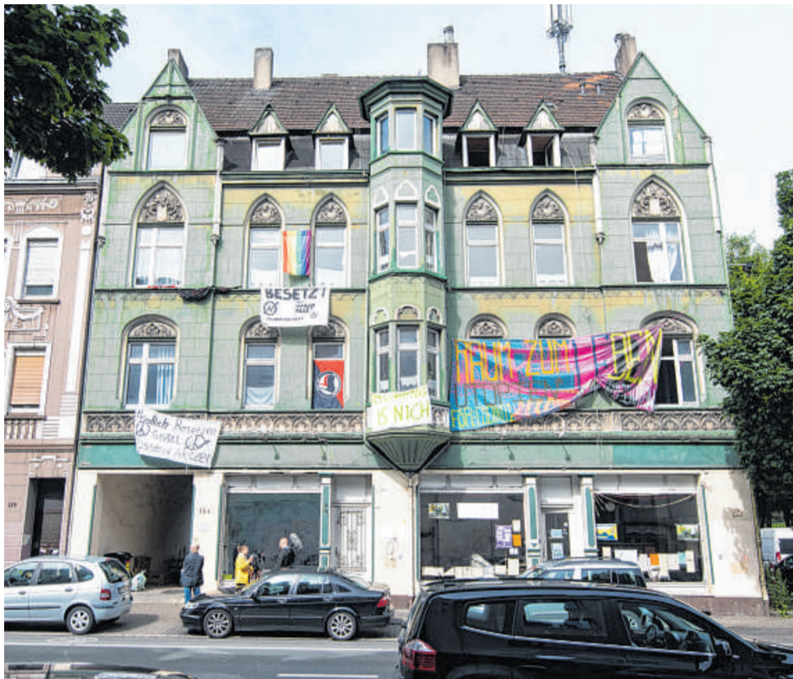
Das leerstehende Haus an der Herner Straße 131 war besetzt. Unten war ein „Stadtteilcafé“ eingerichtet.

Die Idee zu einem ähnlichen Konzept in Bochum kam Kristin Schwierz, die den Abend moderiert, im September. „Eine Kirche